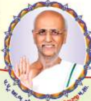
પ.પૂ. આ.ભ. શ્રી કવિન્દ્રસાગરસૂરીશ્વરજી મ.સા.